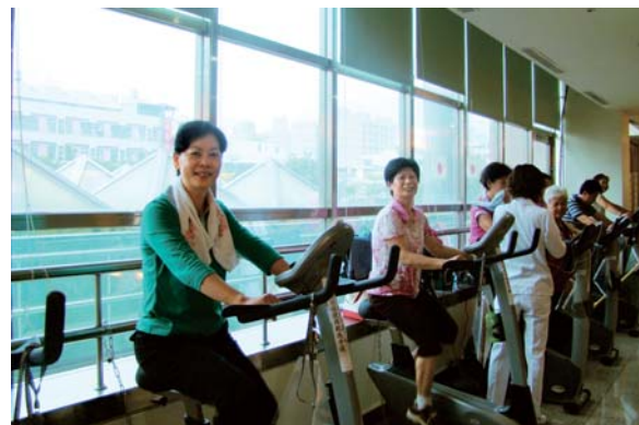
▲本院設有三高運動走廊，建立健康管理與預防保健之觀念

開院迄今已13年，期間曾歷經多次的評鑑。以最近幾次的評鑑而言，無論是新制醫院評鑑、急診評鑑、母嬰親善評鑑或是高危險妊娠評鑑，委員都不約而同的提出，為了讓婦幼照護更完整，可以考量增設小兒加護病房。雖然醫院硬體空間有限，但是為了不斷提升婦幼照護品質，近期已完成規劃新增兒科加護病房，並將重整產房及增設產婦坐月子病床，以符合產婦產後需求，未來亦將主動進行區域醫院垂直整合，透過院際合作模式，整體提昇產婦照護能力，期許成功扮演南高雄地區婦產科醫療重要角色。